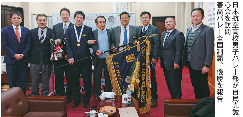
日本航空高校男子バレー部が自民党誠心会を訪問 春高バレー全国制覇、優勝を報告