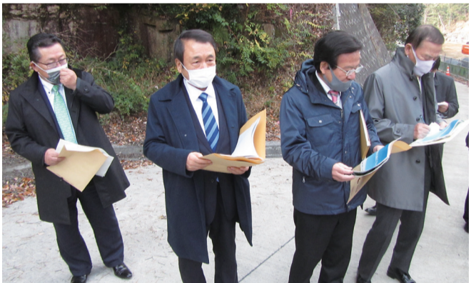
豪雨災害からの復興状況を調査

記録的な大雨により百名の死者が出た土砂災害対策として、砂防堰堤の計画的な整備が進められている。広島よりも急峻な河川を有する山梨県における予防保全対策の必要性を再認識できた。