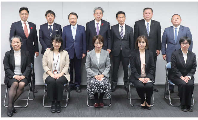
教育厚生委員と介護事業関係者

それで今年、協会に参加させていたいただいて、介護福祉社に入り、基礎研修にも出させていたいただき、ファーストステップ研修にも出させていた。